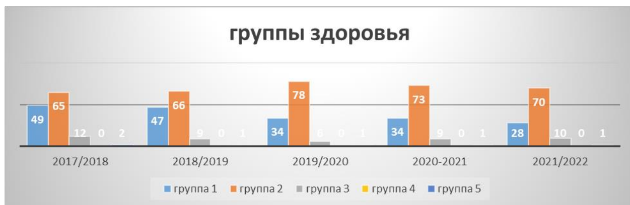
Диаграмма распределения детей по группам здоровья

Всего списочный состав (на конец года) -